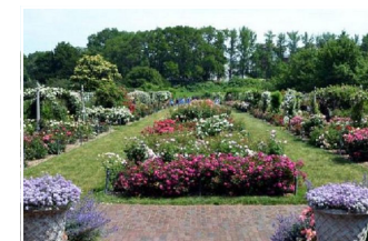
Magnolia Café och Trädgård