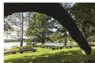
Flämslätt Stifts- och Kursgård